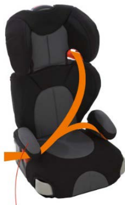
Sædepude med ryglæn

Sædepuden placeres på køretøjets sæde MJ-Bus selen placeres omkring køretøjets sæde, og under køretøjets sikkerhedssele, som vist i afsnit 2.